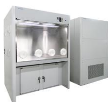
低湿度ドライチャンバー