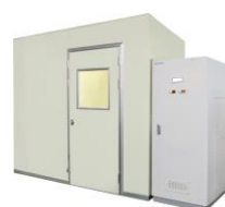
ユニット型ドライルーム