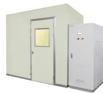
ユニット型ドライルーム